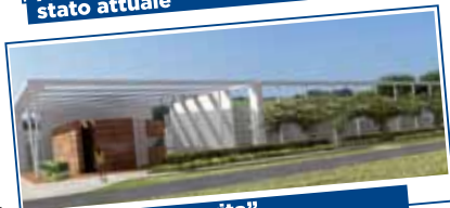
Piscina "La Favorita" proposta d'intervento