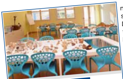
Interno scuola di Puianello

mentare di Quattro Castella e nella scuola media ad indirizzo musicale. Doteremo ogni scuola delle migliori tecnologie per l'istruzione.