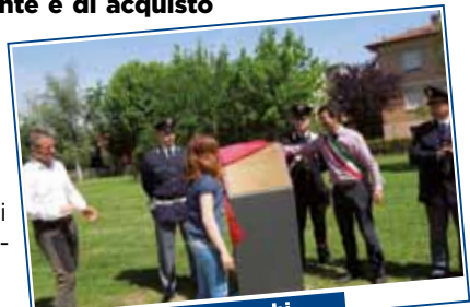
Intitolazione dei parchi alle vittime della mafia

Estenderemo la connessione wi-fi free ai centri di Montecavolo e Puianello.