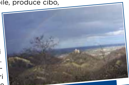
Parco Naturalistico e Archeologico dei Quattro Colli

L'urbanistica non sarà mai più occupazione indiscriminata di suolo. Il suolo assume un valore legato alla sua capacità produttiva agricola ed alla capacità di produrre qualità agroalimentare. Creeremo momenti di confronto e formazione per gli operatori agricoli, per accrescere il valore sociale e produttivo del settore agricolo.