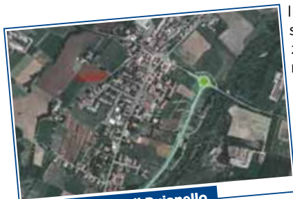
La tangenziale di Puianello

Investimenti: negli ultimi 5 anni sono stati investiti 15.000.000€ in servizi e lavoro, nei prossimi 5 investiremo altri 10.000.000€ per realizzare quanto inserito nel programma.