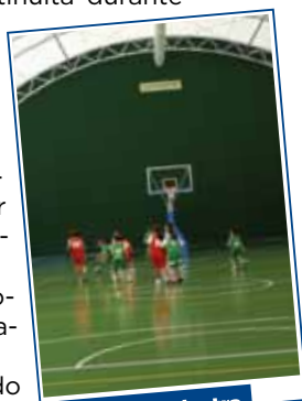
La nuova palestra