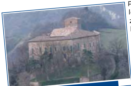
Beni storici e cultura: Castello di Bianello