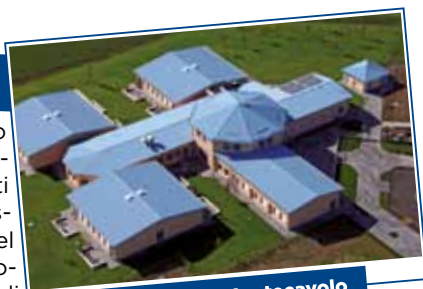
La nuova scuola di Montecavolo

Il Modello Scuole Quattro Castella è misto cioè formato da scuole statali (materna, elementari e medie), scuole comunali (asilo nido), scuole pubbliche paritarie convenzionate con il Comune (scuole materne e asilo nido di Puianello, Montecavolo e Quattro Castella).