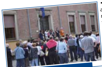
Inaugurazione Casa del Volontariato e dei Servizi

Sviluppiamo l'offerta del Centro per le Famiglie e del Servizio minori . Il Centro per le Famiglie della Pedecollina sostiene le famiglie con iniziative per i genitori, con interventi a favore degli insegnanti,