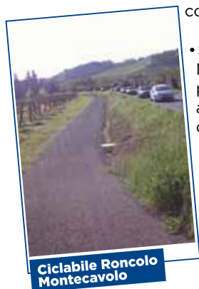
Ciclabile Roncolo Montecavolo

• Sicurezza stradale: collegheremo con piste ciclabili Montecavolo con Roncolo e con Salvarano. I nostri paesi saranno collegati alla rete ciclabile di Reggio attraverso la ciclo pedonale Matildica che unisce anche Vezzano e Albinea.