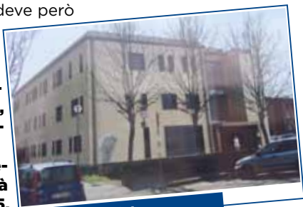
Casa della salute

La Casa della Salute della Pedecollina a Puianello (ex cup), verrà terminata entro la primavera 2015, sarà il luogo dove poter usufruire dei